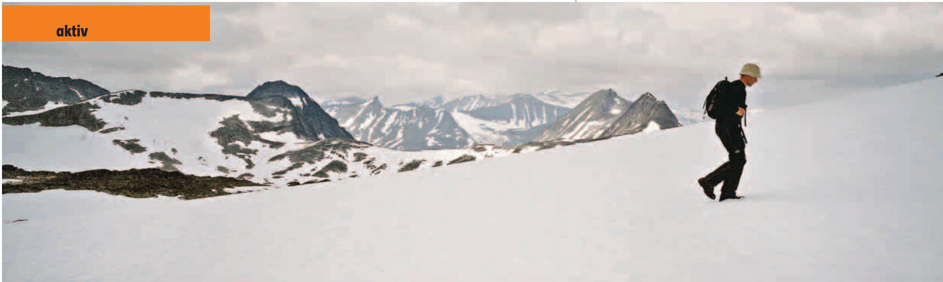
ALENE: 31-åringen fra Høyanger liker seg best når han kommer seg bort fra de oppmerkede løypene.